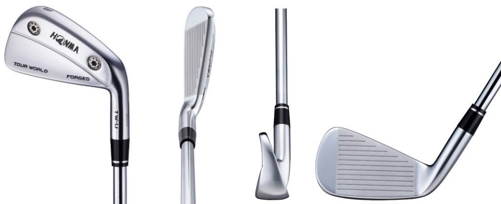
<TOUR WORLD TW-U FORGED #3 >