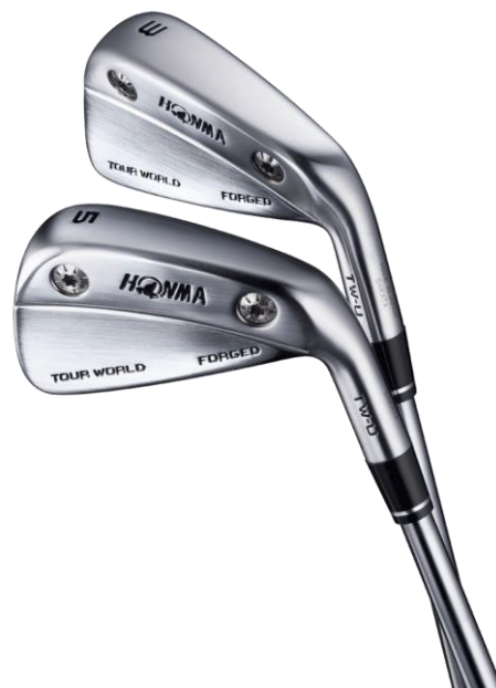
<TOUR WORLD TW-U FORGED>