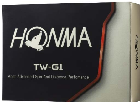
<TOUR WORLD TW-G1>

熱意系ゴルファーの高い要求に応えることをコンセプトとした「TOUR WORLD TW-G1」シリーズは、2014年の発売以来多くの競技志向プレーヤーに愛されてきました。熱意系ゴルファーの多くが求める「飛距離性能」、「ショートゲームにおけるスピン性能」、「コントロール性能」の面において一層の進化を遂げ、NEW『TOUR WORLD TW-G1』『TOUR WORLD TW-G1x』として発売いたします。