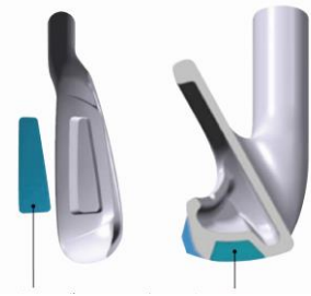
タングステンウエイト 20g

ヘッドスピード 38m/s 以下でもラクにボールをあがりやすくするため、ソールに 20g のタングステンウエイトを装着、さらにワイドソールにすることで低・深重心化を実現。また、ワイドソールでありながら抜けの良さを追求したソール形状で、シビアなライにも対応でき、ミスヒット時でもボールが拾いやすい。