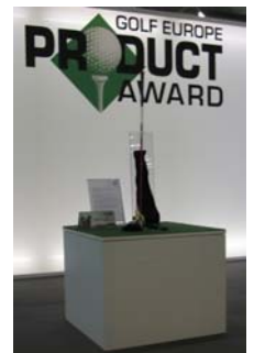
GOLF EUROPE PRODUCT AWARDS 2010