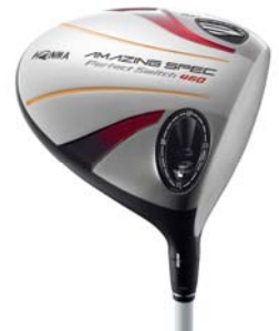
Perfect Switch 460 <78,750 円(税込)>

欧州のゴルフ業界関係者を対象にあらゆるゴルフ用品が展示される、欧州最大のゴルフ見本市「ヨーロッパゴルフ見本市」(2010年9月26日～9月28日、ドイツ・ミュンヘン)の開催期間中に選出。機能性・デザイン性・画期性・使いやすさを基準に、ゴルフクラブ、アクセサリ、ウェアなどの部門ごとに賞が与えられ、昨年は、シーンに合わせてヘッドを交換できる『Perfect Switch』(パター)が、同じくゴルフクラブ部門で最優秀賞を受賞しております。