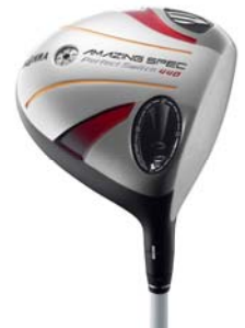
Perfect Switch 440 <78,750 円(税込)>