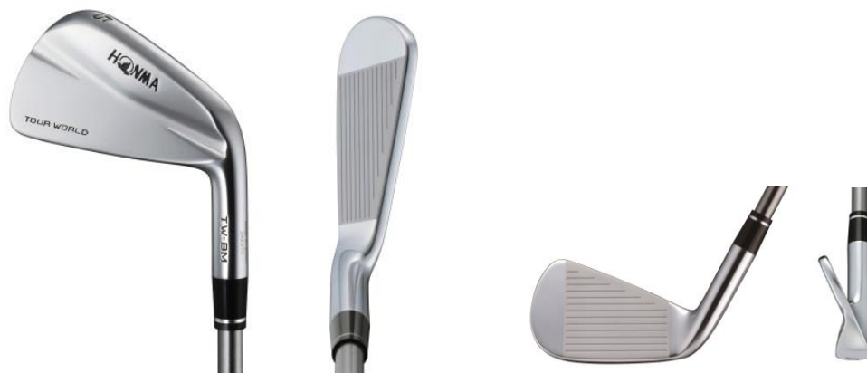
TOUR WORLD TW-BM

『TOUR WORLD TW-BM』の概要につきましては、次頁以降をご参照ください。