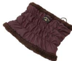
裏ボアネックウォーマー