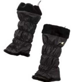
裏ボアレッグウォーマー