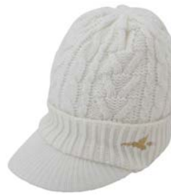
裏フリースニットキャスケット