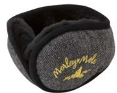
イヤークォーマー