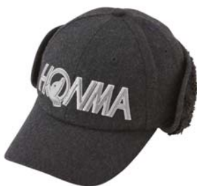
耳あてつきキャップ