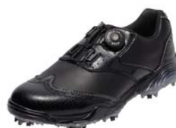
ブラック/ブラック