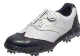
ネイビー/ホワイト