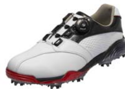
ホワイト/ブラック