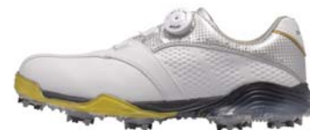
ホワイト/シルバー

品名 : SS-1602 素材 : 甲(人工皮革)、底(EVA スポンジ/TPU) サイズ : 25.0~28.0cm ウィズ : 3E 重量 : 約 460g(片足) カラー : ホワイト/シルバー、ホワイト/ブラック、ホワイト/ブルー 仕様 : 防水タイプ 価格 : ¥18,000+税 原産国 : 中国