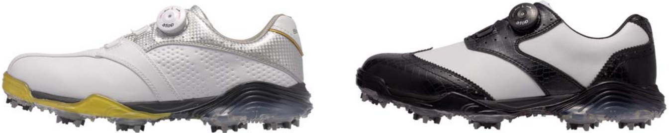
ダイヤル式ゴルフシューズ(2タイプ)