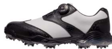
ブラック/ホワイト

品名 : SS-1603 素材 : 甲(人工皮革)、底(EVA スポンジ/TPU) サイズ : 24.5~27.5cm ウィズ : 3E 重量 : 約 450g(片足) カラー : ブラック/ホワイト、ブラック/ブラック、ネイビー/ホワイト 仕様 : 防水タイプ 価格 : ¥18,000+税 原産国 : 中国