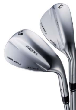
『TOUR WORLD NEW TW-W』